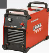
TOMAHAWK 1538 K12039-1