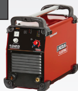
TOMAHAWK 1025 K12048-1