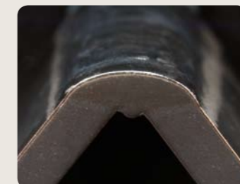
Een stabiele boog zorgt voor een gladde las en een sterke aanhechting op het basismateriaal. Dit zorgt voor goede mechanische eigenschappen van de las.